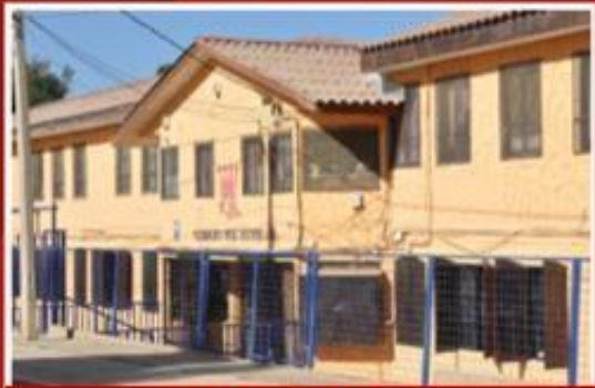
SEDE LUIS LARCO