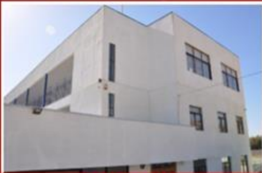
SEDE EL SAUCE