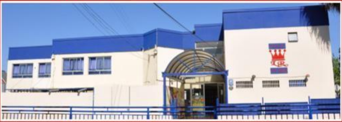
SEDE LOS REYES, donde la historia comienza