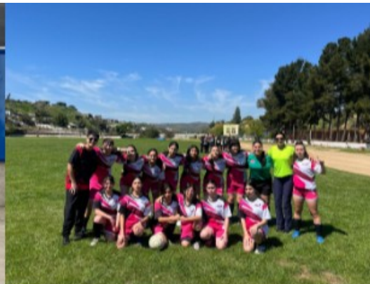
Juegos de primavera