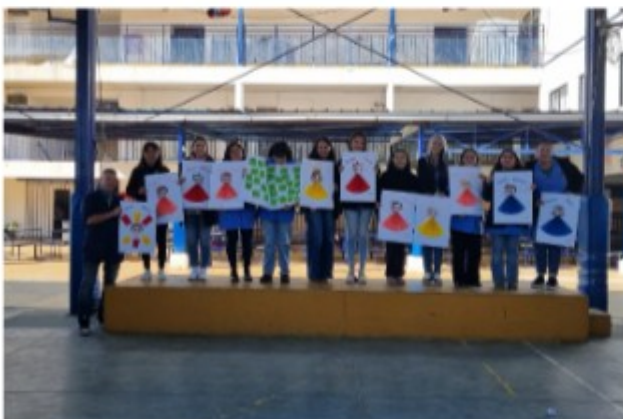
“Día del Asistente”