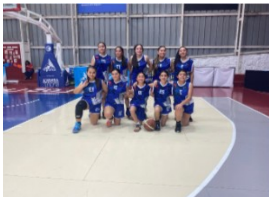
Básquetbol Categoría Infantil, juegos escolares