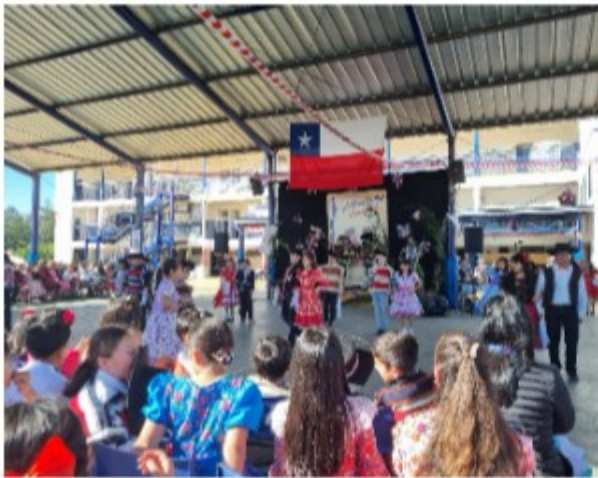
“Cuecas” viernes 12 de septiembre

Finalmente, el 1 de octubre, en el Día del Asistente de la Educación, los estudiantes entregaron tarjetas de agradecimiento, cantaron una canción donde expresaron el agradecimiento a todos ellos y culminaron con un rico desayuno, merecido por todo el apoyo y sacrificio que brindan a nuestro querido colegio.