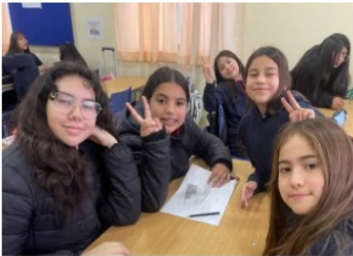
Jornada “Presentes contra la violencia”

En la misma línea, el martes 23 de septiembre, en la sede El Sauce, se realizó el reconocimiento a los “Embajadores del Buen Trato”. En cada curso, un varón y una dama fueron destacados por sus compañeros por promover con su ejemplo el respeto, la empatía y la sana convivencia, inspirando así a toda la comunidad educativa.