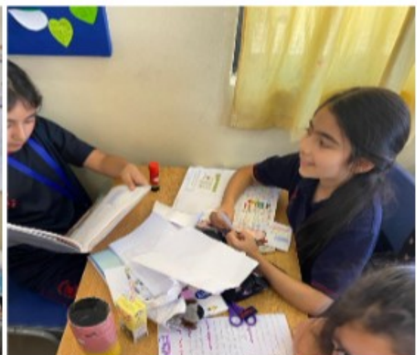
Estudiantes creando "Revistas Comparativas"