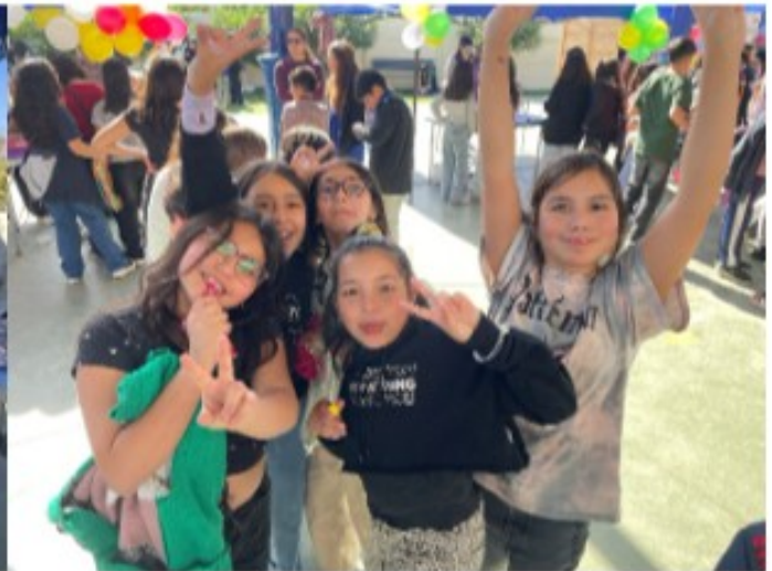
Día de la niñez