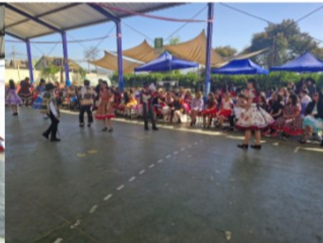
“Bailes Tradicionales” 10 de septiembre