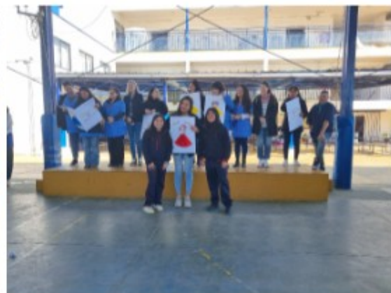
“Día del Asistente”