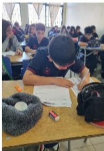
“Evaluación Pleno Santillana”