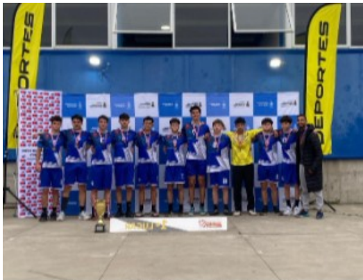
Balonmano Categoría Juvenil

Finalmente, en el marco de los Juegos Escolares 2025, el equipo de Básquetbol Infantil Varones logró un meritorio 3er lugar regional, sumando un nuevo reconocimiento al palmarés deportivo de la institución. Estos resultados reflejan el esfuerzo, la dedicación y el espíritu deportivo que caracterizan al Colegio Los Reyes, consolidándolo como un referente en el ámbito escolar de la región.