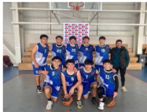
Básquetbol Categoría Infantil, juegos escolares