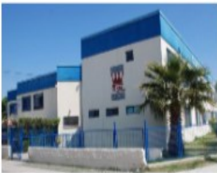
Sede Los Reyes 2025

Con el paso de los años, la institución fue creciendo y ampliando sus espacios: en el año 2000 se inauguró la Sede Luis Larco, mientras que en 2019 abrió sus puertas la Sede El Sauce. Durante estas tres décadas, el colegio ha destacado por su énfasis en el desarrollo cultural, deportivo y artístico, ofreciendo a sus estudiantes talleres en diversas áreas, desde deportes y arte hasta tecnología y ciencias, acercando la cultura y el arte a la vida escolar.