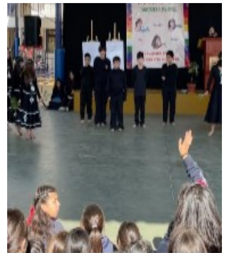
“Feria de Humanidades”