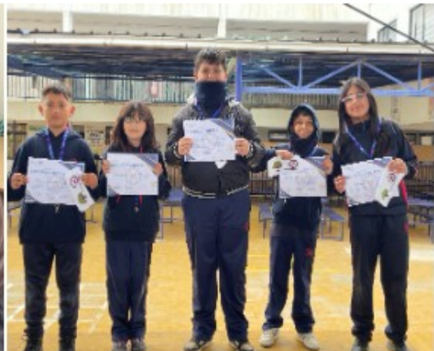
Premiación “Embajadores del buen trato”