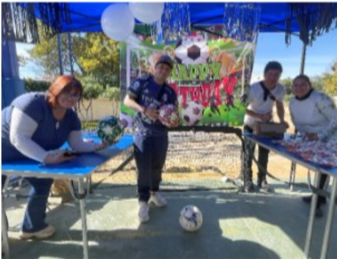
Apoderados en “El día de la niñez”

La jornada comenzó con una breve instancia de reflexión sobre el origen de esta conmemoración y finalizó con una convivencia organizada por las familias, donde reinó la amistad y la gratitud.