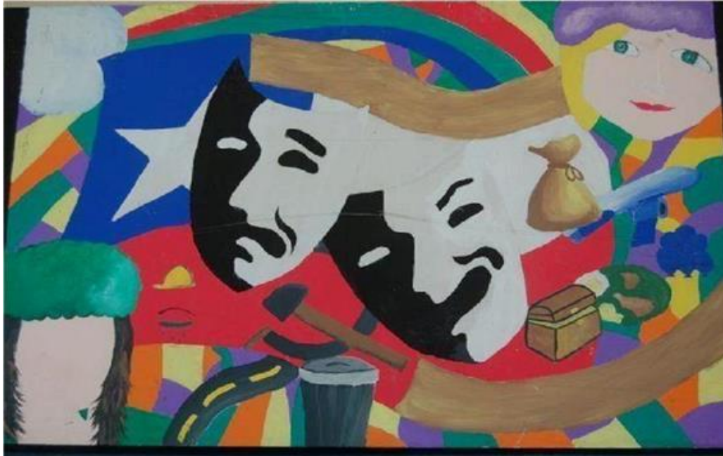
Mural realizado por alumnos de Cuarto Medio Electivo Artes 2012 (Dedicado a Convivencia Escolar y la No Discriminación)